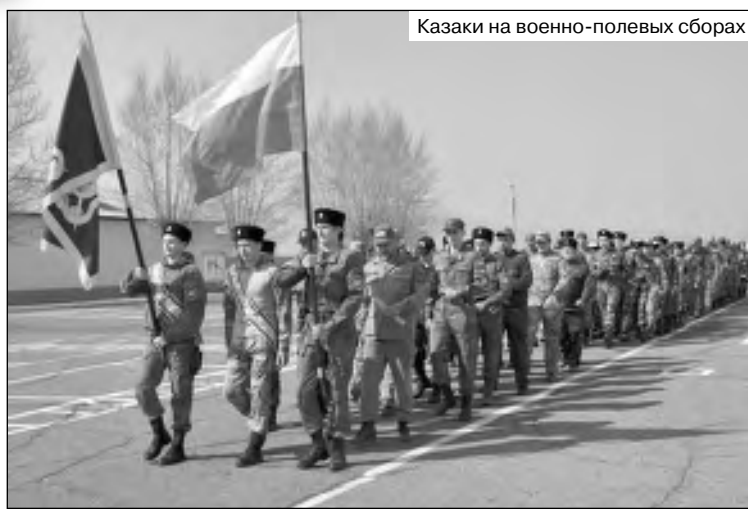
Казачи на военно-полевых сборах

Вернусь к проведенным в этом году мероприятиям. По