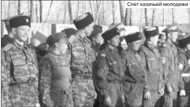
Слет казачьей молодежи