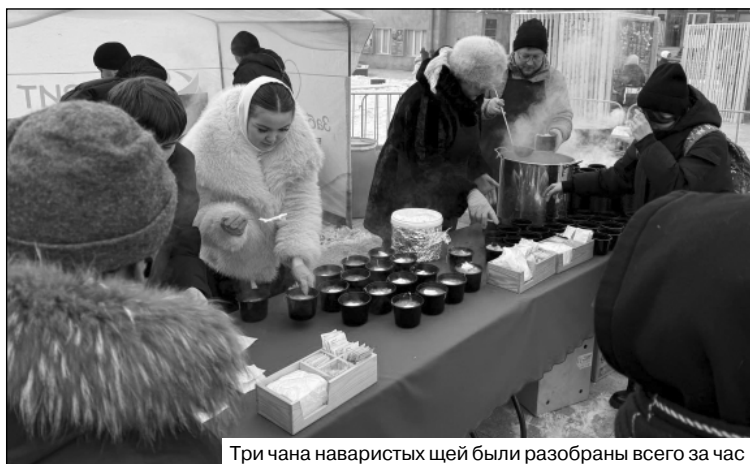
Три чана наваристых щей были разобраны всего за час