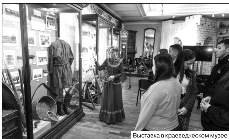
Выставка в краеведческом музее