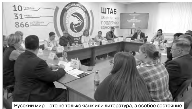
Русский мир – это не только язык или литература, а особое состояние

Этот первый форум стал большим событием, призванным укрепить связи между людьми, объединенными общими ценностями и стремлением к сохранению самобытности. Участники, прибывшие из самых разных уголков страны, смогли не только обсудить насущные вопросы, но и почувствовать себя частью большого русского мира, где уважение к истории и