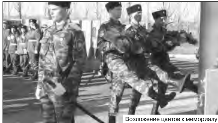
Возложение цветов к мемориалу

поручению губернатора мы участвовали в спартакиаде казачьей молодежи и провели слет казачьей молодежи. В обоих мероприятиях первое место заняли казаки из дудьдургинской школы. Они также представляли нас на всероссийских соревнованиях, где заняли пятое место и четвертое место на слете ГТО.