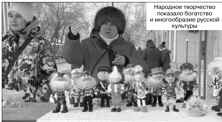
Народное творчество показало богатство и многообразие русской культуры

В завершение круглого стола спикеры пришли к выводу,