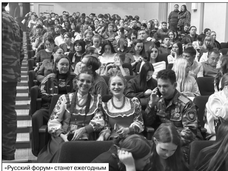
«Русский форум» станет ежегодным

что укрепление русского мира в Забайкалье – это комплексная задача, требующая совместных усилий государственных институтов, общественных организаций, научного сообщества и самих граждан. Только через диалог, взаимное уважение и осознанное сохранение культурного наследия