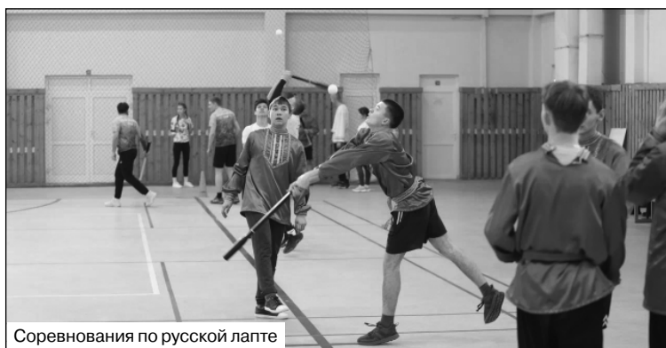
Соревнования по русской лапте