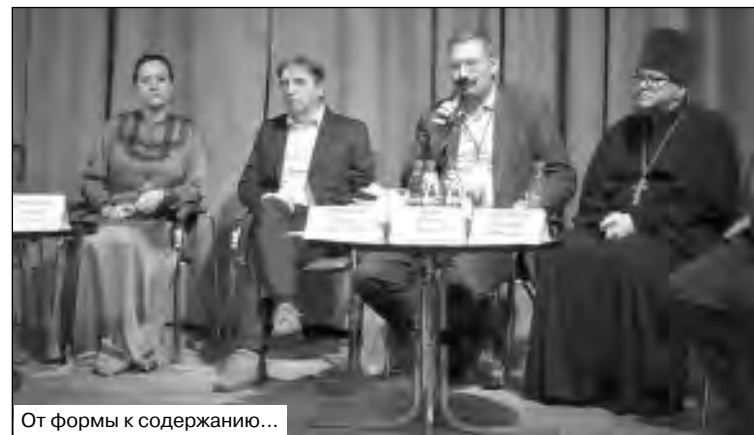
От формы к содержанию...

Беседовал Валентин ОЛЕЙНИКОВ