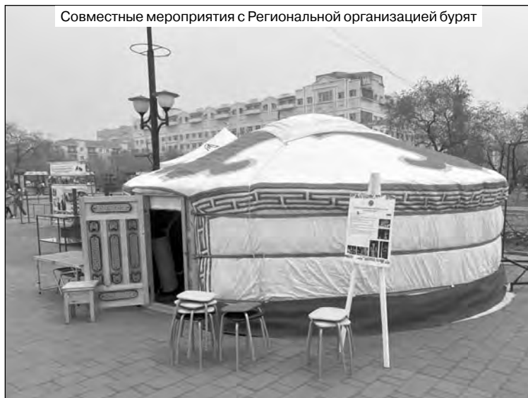
Совместные мероприятия с Региональной организацией бурят