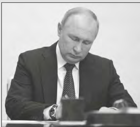
Согласно указу президента Владимира Путина с 1 января 2026 года страна будет жить по новым правилам ради укрепления единства многонационального народа России

Президент России Владимир Путин утвердил новую Стратегию государственной национальной политики на период до 2036 года. Соответствующий Указ подписан 25 ноября 2025 года. Документ вступит в силу 1 января 2026 года. Указ утвержден в целях координации деятельности федеральных и региональных органов власти, местного самоуправления и иных органов в сфере национальной политики, а также обеспечения их взаимодействия с институтами гражданского общества.