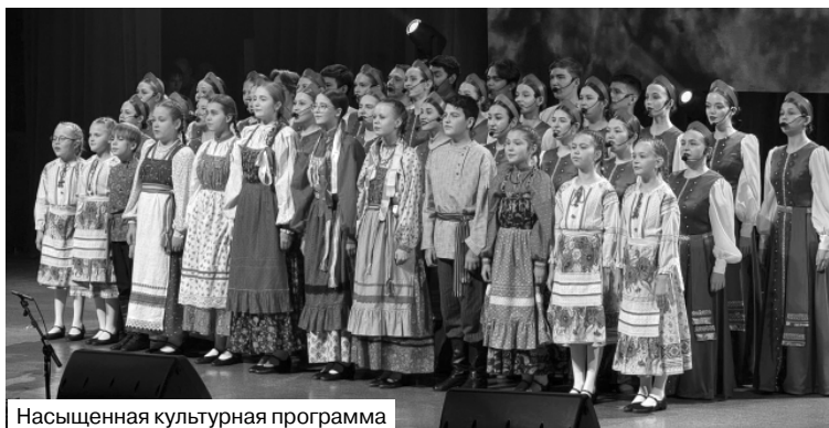
Насыщенная культурная программа

щая региона получила должное признание и поддержку, что станет важным шагом к укреплению русского мира в Забайкалье и в целом в России.