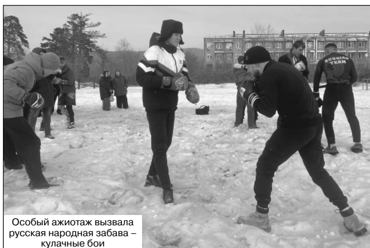
Особый ажиотаж вызвала русская народная забава – кулачные бои