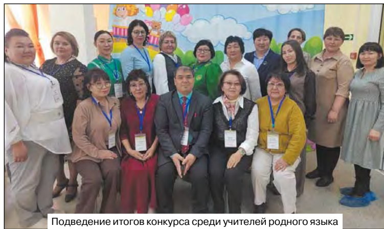
Подведение итогов конкурса среди учителей родного языка