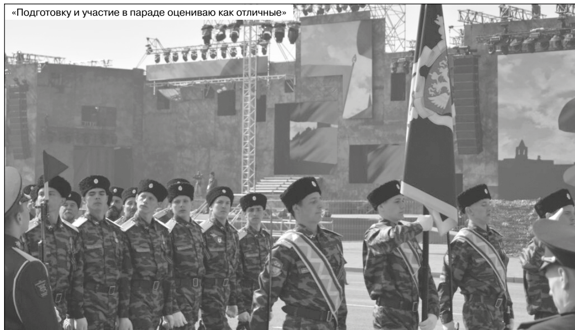
«Подготовку и участие в параде оцениваю как отличные»