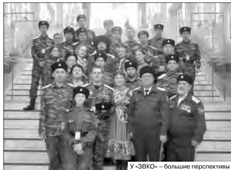
У «ЗВКО» – большие перспективы