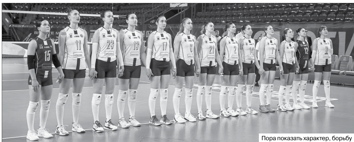
Пора показать характер, борьбу

Валентин ОЛЕЙНИКОВ