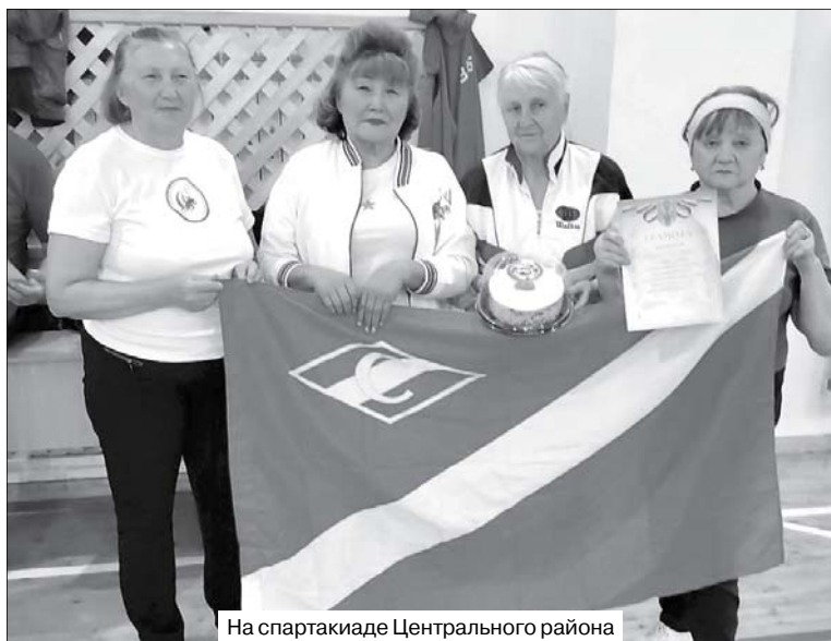
На спартакиаде Центрального района

Виктория СИВУХИНА