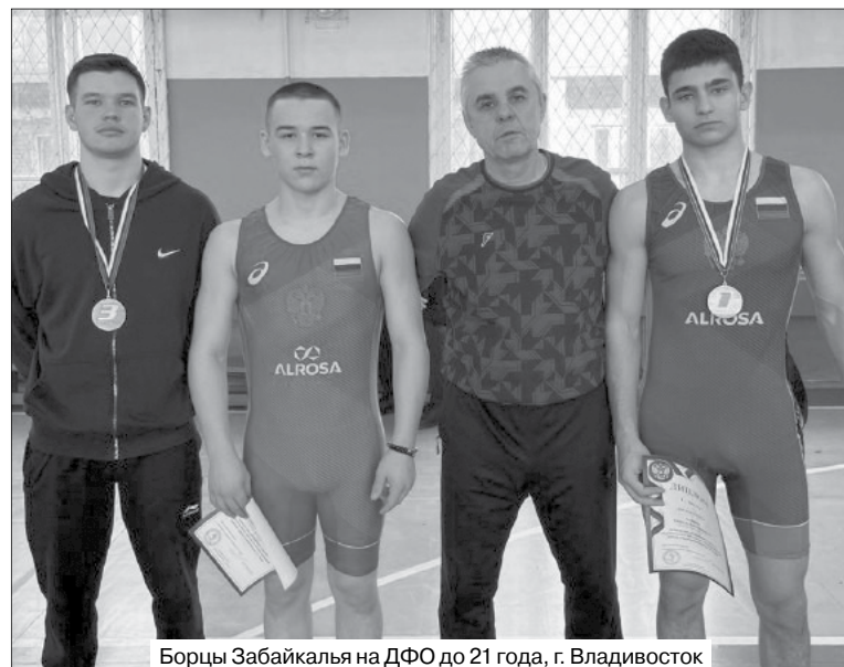
Борцы Забайкалья на ДФО до 21 года, г. Владивосток