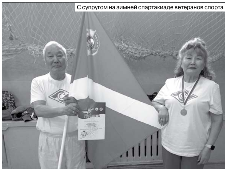
С супругом на зимней спартакиаде ветеранов спорта