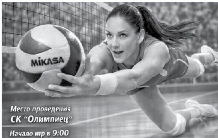
Место проведения СК «Олимпиец» Начало игр в 9:00

Будьте готовы к зрелищным матчам, бурным эмоциям, жесткой борьбе и командному взаимопониманию на площадках спорткомплекса «Олимпиец».