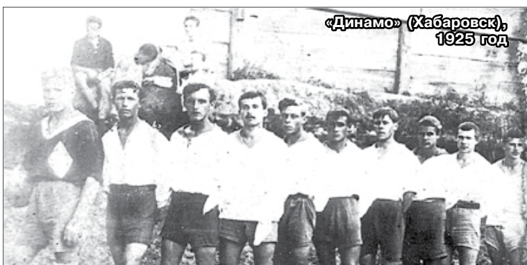
«Динамо» (Хабаровск), 1925 год

«...Хабаровск вышел в числе только 9 человек. ...Чита, несмотря на численный перевес, не могла сделать ни одного значительного прорыва. Защита была сильна и отбивала энергичное нападение. За отсутствием средних форвардов (инсайд) Хабаровск не мог серьёзно перейти в наступление и поэтому ограничился только несколькими прорывами... 2 хавтайм при своём развитии тоже показывал, что перевеса не было ни на той, ни на другой стороне. Обе команды обменялись пендалями. Читинцы промахнулись. Хабаровский мяч голкипер Читы принял в руки. До конца игры оставалось не более 10 минут. ...С обеих сторон делались окончательные попытки напоследок прорваться и забить гол. ...И только в самое последнее время с корнера, который подавала Чита, был забит гол». Хаба-