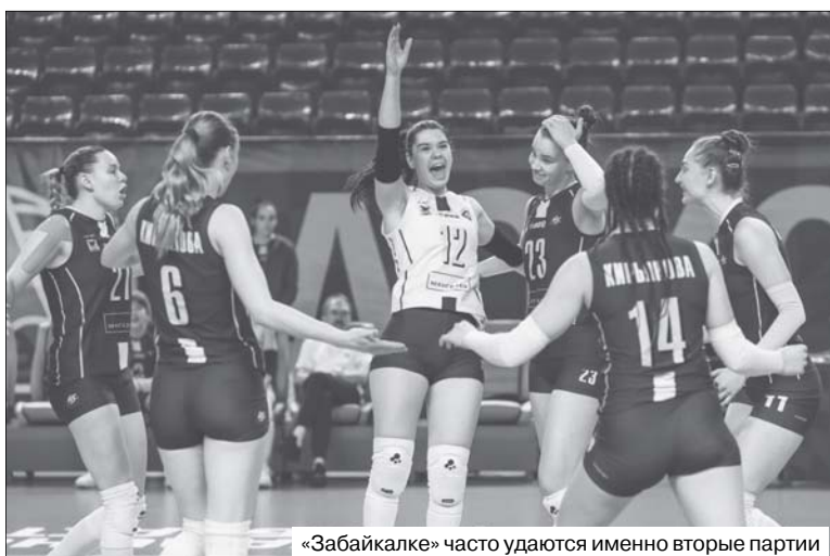
«Забайкалке» часто удаются именно вторые партии