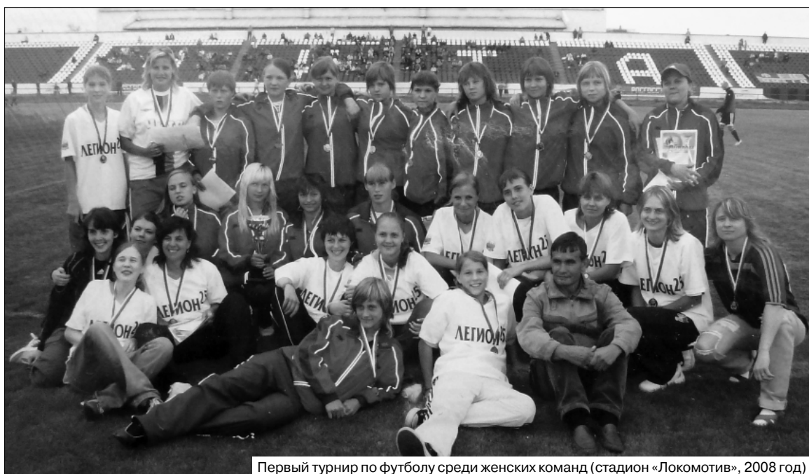
Первый турнир по футболу среди женских команд (стадион «Локомотив», 2008 год)