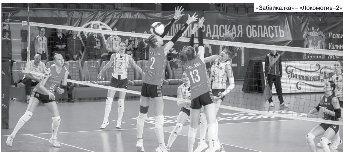
«Забайкалка» – «Локомотив-2»