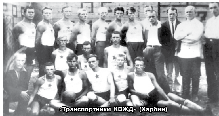
«Транспортники КВЖД» (Харбин)

серию товарищеских игр с хабаровскими и благовещенскими коллективами, говоря по правде, «межсоюзники» к спартакиаде подготовились плохо. В ней, кроме хабаровчан, участвовали команды Благовещенска, Читы и... Харбина. Да, харбинцы играли на спартакиаде, но это были граждане СССР, служившие на КВЖД. Интересно, что на хабаровскую спартакиаду почему-то не были допущены владивостокские футболисты, имевшие сильный состав. (Точных причин мы пока не знаем). На турнире была применена «мудрёная» полуолимпийская система, где после проведения двух туров отсеивались команды, проигравшие дважды. Два сильнейших коллектива проводили финал. Игры прошли на спортплощадке «Динамо», располагавшейся на территории нынешнего театра драмы. «Тихоокеанская звезда» предоставила подробнейшие отчёты игр, которые мы публикуем с сокращениями.