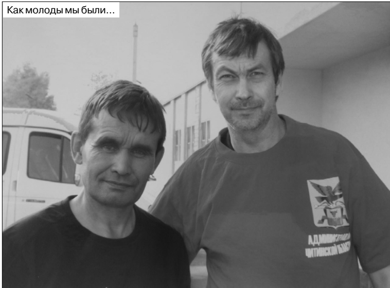
Как молодцы мы были...