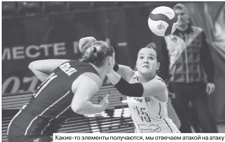
Какие-то элементы получаются, мы отвечаем атакой на атаку

Завершающая игра тура против калининградского «Локомотива» также принесла по-