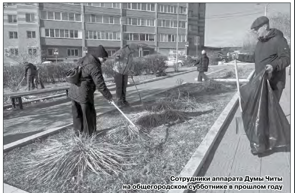
Сотрудники аппарата Думы Читы на общегородском субботнике в прошлом году