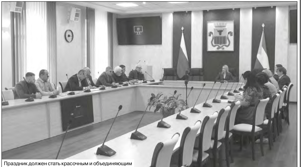
Праздник должен стать красочным и объединяющим

Особое внимание организаторы уделяют реконструкции традиционного праздника Троица,