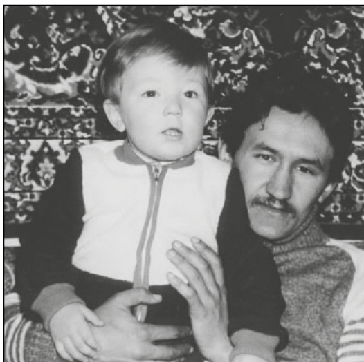
«Наш брак крепкий получился благодаря детям. Они – основа всего. Прежде всего, это ответственность! Вместе – и горе, и радость, и всё пополам»