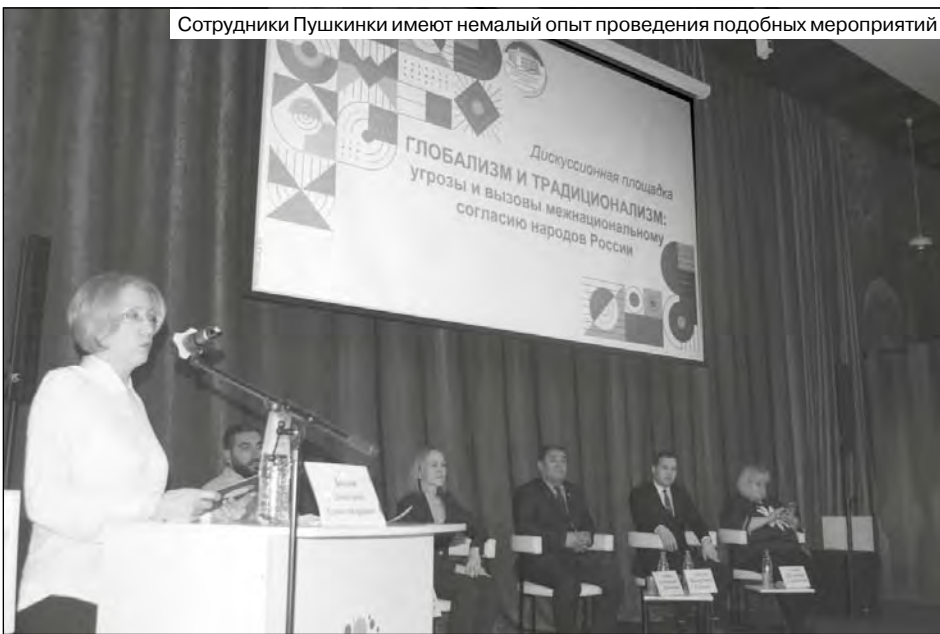
Сотрудники Пушкинки имеют немалый опыт проведения подобных мероприятий