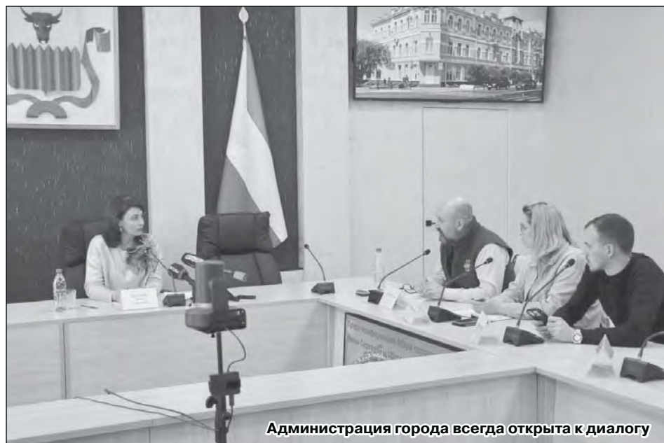
Администрация города всегда открыта к диалогу

На конференции также обсуждался проект «Свет в городе». Этот социокультурный проект, запущенный в феврале креативными предпринимателями Забайкальского края совместно с жителями Читы, направлен на переосмысление городской среды через современное световое искусство и развитие креативных индустрий. Проект реализуется при поддержке госкорпорации ВЭБ.РФ. По словам мэра, его ре-