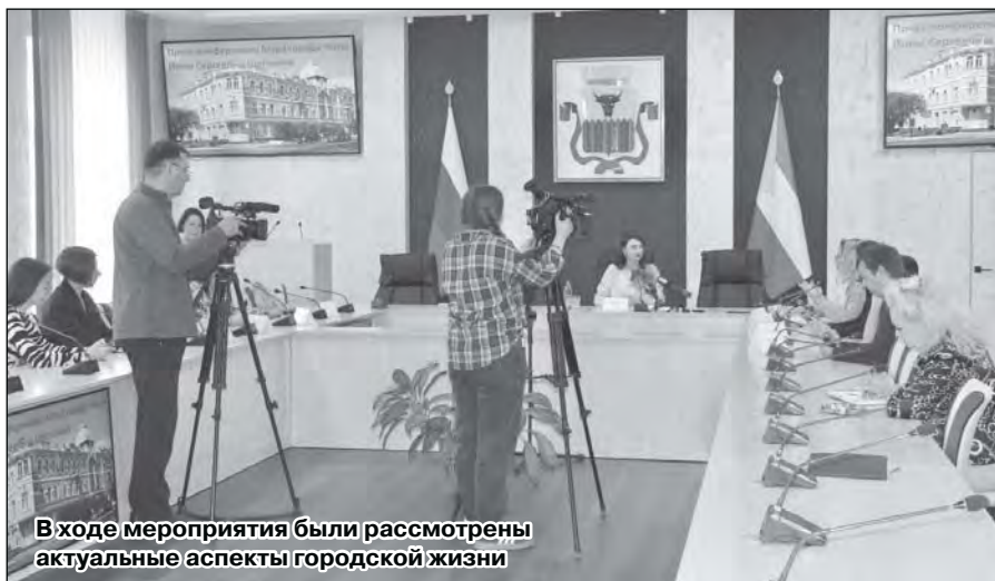
В ходе мероприятия были рассмотрены актуальные аспекты городской жизни