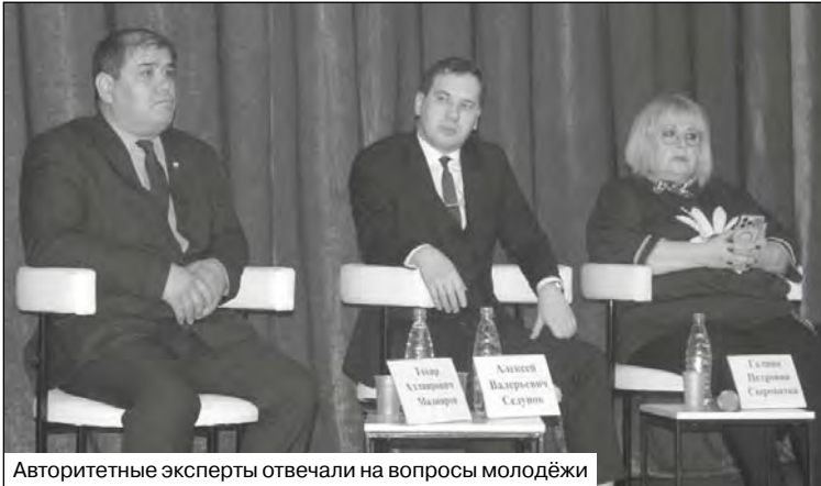
Авторитетные эксперты отвечали на вопросы молодёжи

Сегодня, когда информационные потоки охватывают все стороны нашей жизни и стирают границы между странами, когда глобализация, казалось бы, должна стать средством достижения мира и согласия, неожиданно остро встал вопрос противостояния глобализма и традиционализма. Диалог на эту тему состоялся в «Точке кипения» Забайкальской краевой научной библиотеки им. А. С. Пушкина.