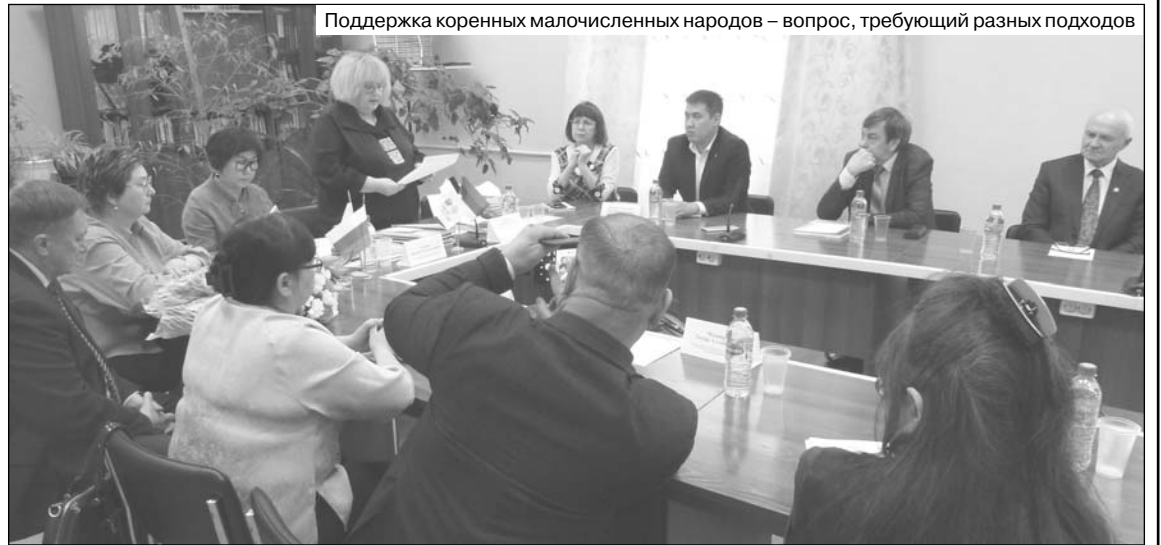
Поддержка коренных малочисленных народов – вопрос, требующий разных подходов

«Россия – уникальное государство, где веками мирно сосуществуют сотни народов. Каж-