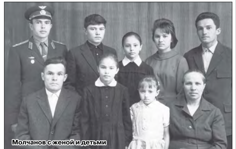
Молчанов с женой и детьми

Людмила МАЛЬЦЕВА