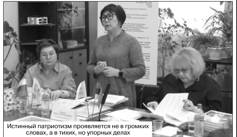
Истинный патриотизм проявляется не в громких словах, а в тихих, но упорных делах