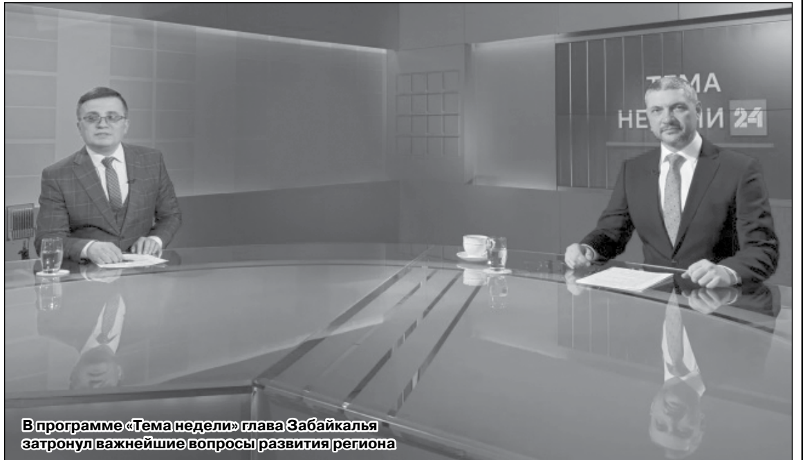
В программе «Тема недели» глава Забайкалья затронул важнейшие вопросы развития региона

«Нужно улучшать жизнь людей там, где они работают», – сказал Юрий Трутнев.