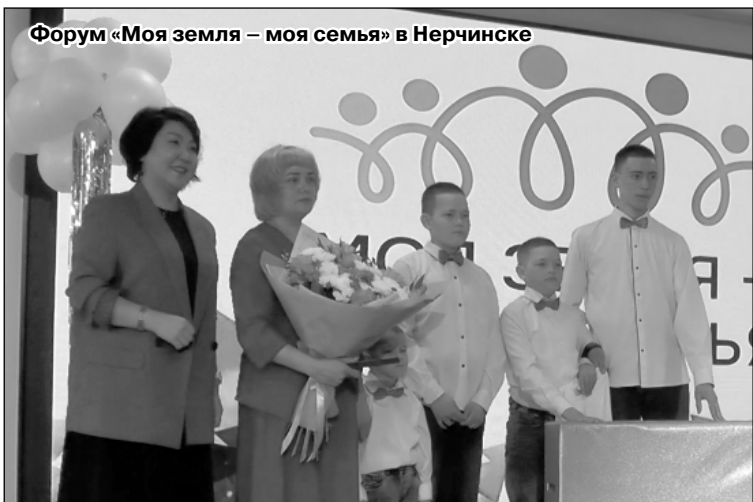
Форум «Моя земля – моя семья» в Нерчинске