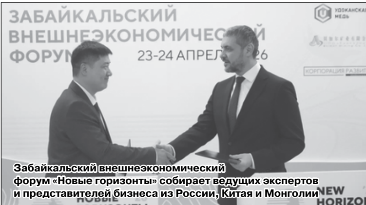
Забайкальский внешнеэкономический форум «Новые горизонты» собирает ведущих экспертов и представителей бизнеса из России, Китая и Монголии