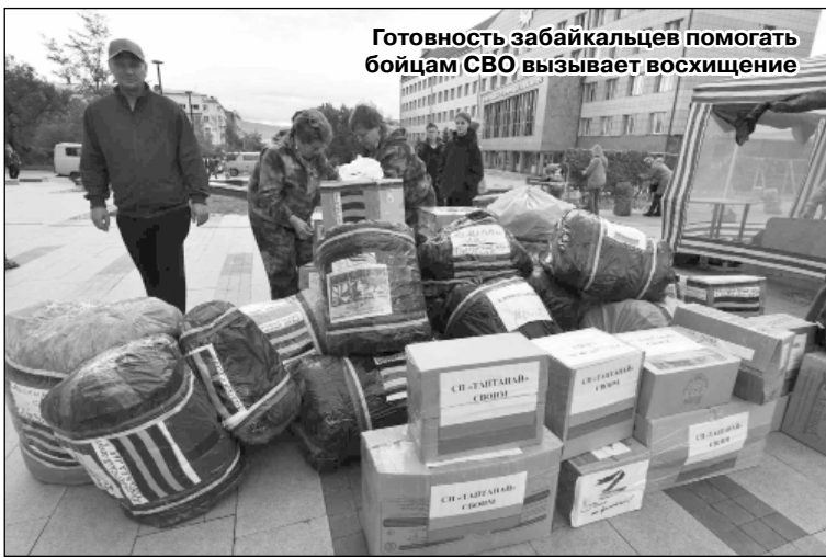
Готовность забайкальцев помогать бойцам СВО вызывает восхищение

«На данном этапе необходимо дальше заниматься и восстановлением дорог, и развитием социальной сферы, и восстановлением экономической жизни этих сел. Кроме того, нужно ремонтировать социальные объекты, некоторые из них уже находятся в стадии ремонта. Но самое важное, что нужно сделать, это восстановить все автомобильные дороги. Дорогу на Красный Чикой от Баляги мы делаем, а на