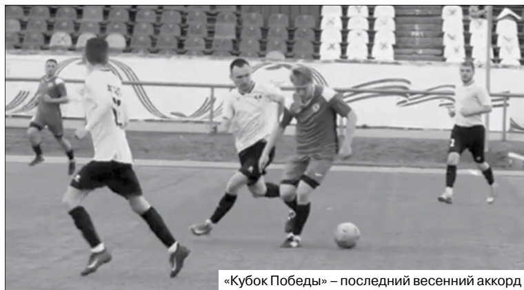
«Кубок Победы» – последний весенний аккорд

Именно финансовый тупик привёл к тому, что в «Багульнике», Кубке Победы и чемпионате