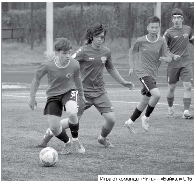
Играют команды «Чита» – «Байкал» U15

Пятый тур Юношеской футбольной лиги в Черемхове принёс нашим командам полярные результаты.