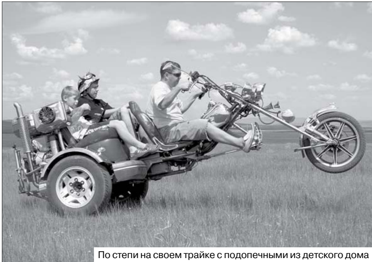
По степи на своем трайке с подопечными из детского дома