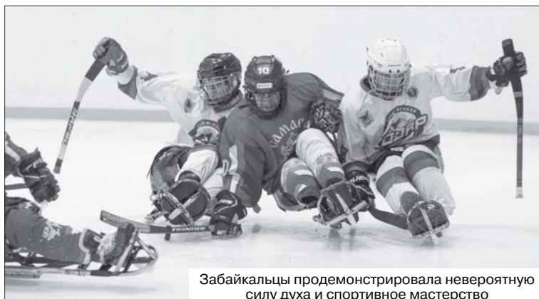
Забайкальцы продемонстрировала невероятную силу духа и спортивное мастерство

характер и самоотдачу. Мы играли против сильной и организованной сборной Самарской области, которая к тому же была на своей площадке. Да, мы уступили 2:4, но я горжусь тем, как ребята боролись до самого конца. Завоевать серебро – это отличный результат, который стал итогом работы на протяжении всего сезона. И, конечно, отдельное спасибо всем, кто нас поддерживал», – рассказал тренер