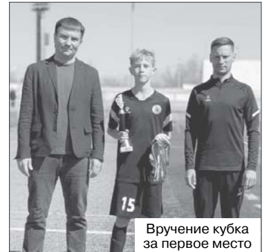
Вручение кубка за первое место

го футбола в регионе, а также пожелал спортсменам дальнейших успехов и новых побед.