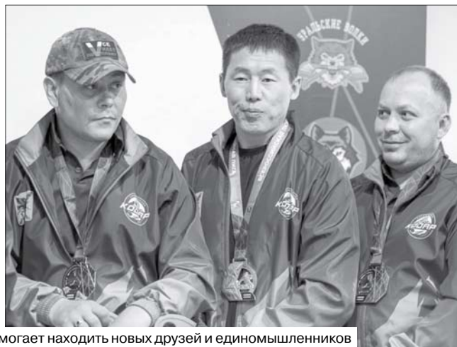
Спорт формирует командный дух, помогает находить новых друзей и единомышленников

командой «Ратник» из Марий Эл, победив со счётом 5:1.