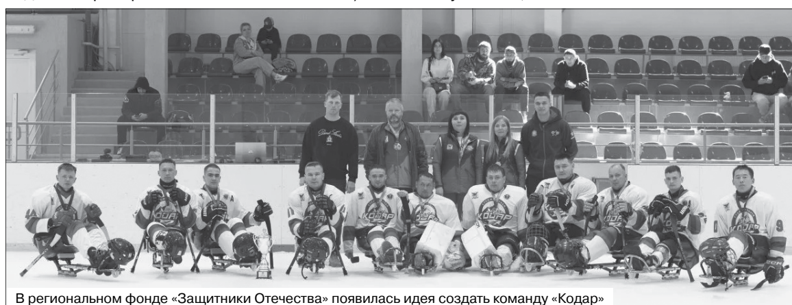
В региональном фонде «Защитники Отечества» появилась идея создать команду «Кодар»

Елена ЛОСКУТНИКОВА