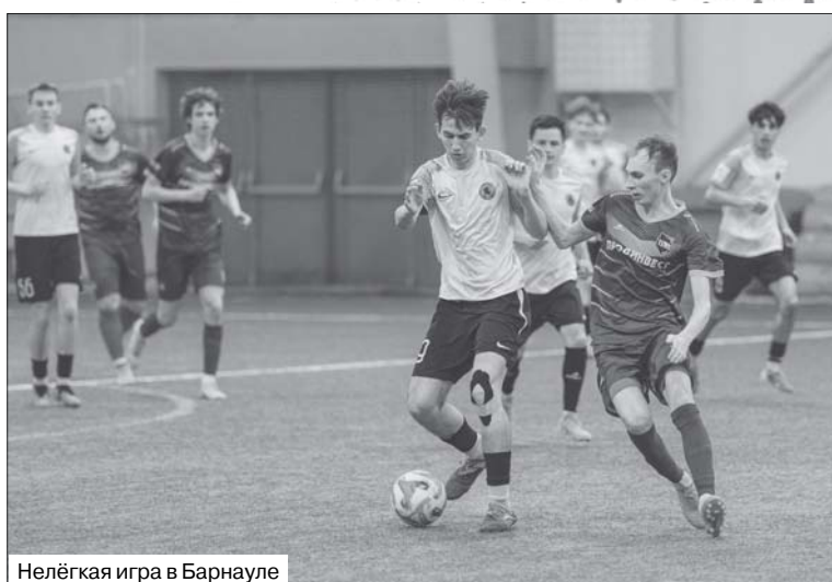
Нелёгкая игра в Барнауле

Теперь предстоят домашние игры. Уже завтра соперником «Читы» будет «Байкал» из Иркутска. Забайкальцы с командами под названием «Байкал» играли многие годы. Сегодня «Байкал» – это областная школа по футболу. В нынешнем сезоне, как и «Чита», она участвует в Третьей лиге, Кубке Сибири и Юношеской футбольной лиге. В турнире Третьей лиги «Байкал» успехов пока не добился, не считая неожиданной гостевой разгромной победы над «Распадской» 24 апреля. За два дня до этого