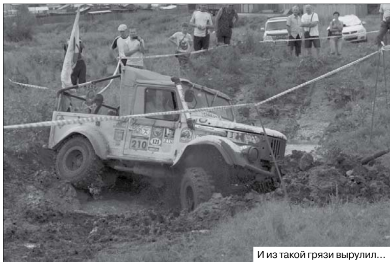
И из такой грязи вырулил...

автомобилях – такое наверняка останется в детских душах.