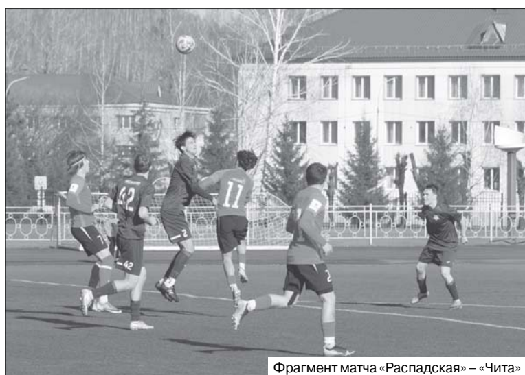
Фрагмент матча «Распадская» – «Чита»

Завтра, 29 мая, команда «Чита» начнёт серию первых в нынешнем сезоне домашних матчей в Третьей лиге (зона «Сибирь», «Золото»).