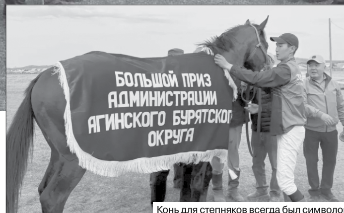
Конь для степняков всегда был символом верности, силы и дружбы

Турнир станет отборочным этапом для участия в Международном бурятском фестивале «Алтаргана», который будет проходить с 1 по 5 июля в Улан-Удэ.