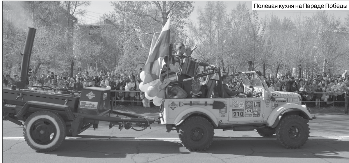
Полевая кухня на Параде Победы

Но самое главное – общение. На кадрах видеосъёмки такие счастливые детские лица. Праздники на природе с участием артистов оригинального жанра, настоящих клоунов и сказочных героев, призы и подарки, катание на экзотических