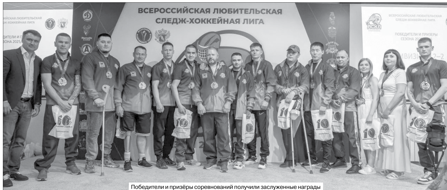
Победители и призёры соревнований получили заслуженные награды

«В первую очередь хочу поблагодарить свою команду. Ребята показали невероятные