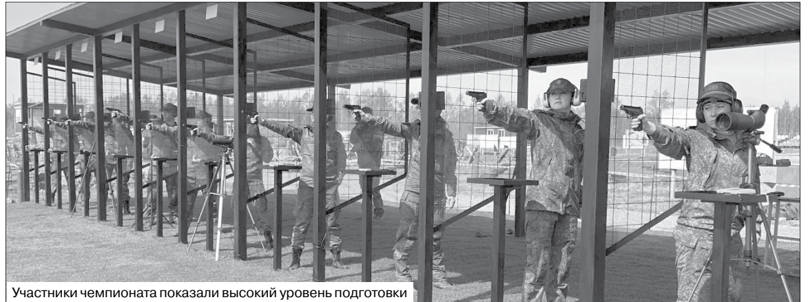
Участники чемпионата показали высокий уровень подготовки