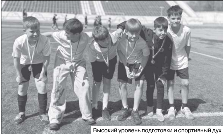
Высокий уровень подготовки и спортивный дух

В столице Забайкалья успешно прошло первенство Забайкальского края по футболу среди юношей 2012-2013 годов рождения. В соревнованиях приняли участие шесть команд, которые продемонстрировали высокий уровень подготовки и спортивный дух.