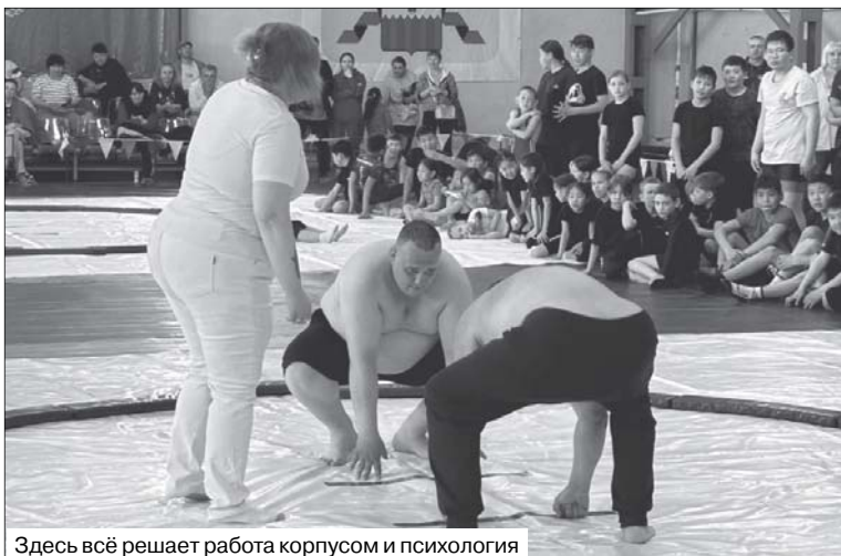
Здесь всё решает работа корпусом и психология