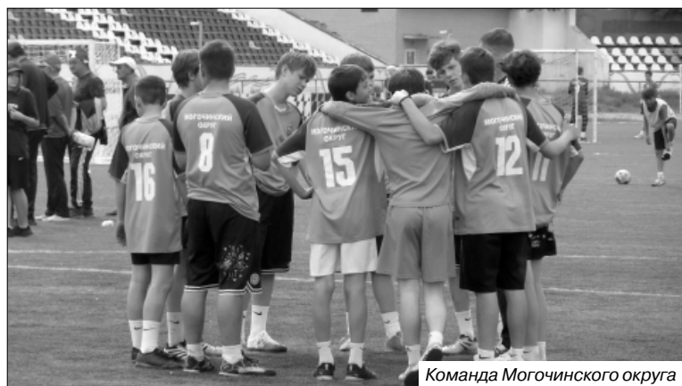
Команда Могочинского округа