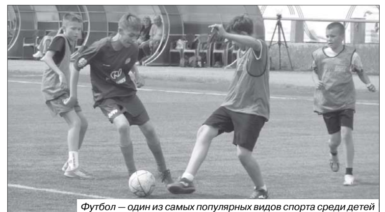
Футбол – один из самых популярных видов спорта среди детей