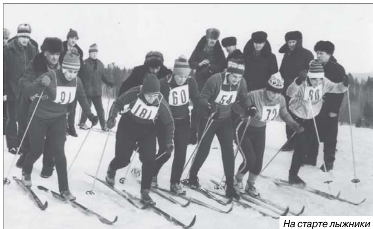
На старте лыжники

Как важно геологам быть спортсменами – никому не требуется объяснять. Министерство геологии СССР и руководство горнодобывающей отрасли с первых лет занимались созданием системы подготовки физически крепких, выносливых специалистов и воспитанием чемпионов. Во всех коллективах это было одним из главных направлений деятельности, а итоги подводили на спартакиадах через каждые четыре года. Спортивные достижения всегда были предметом особой гордости.