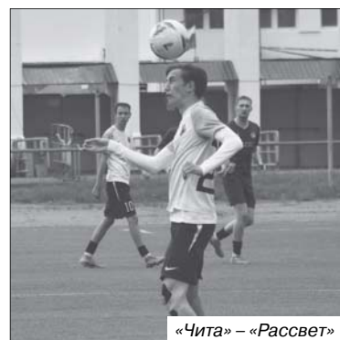
«Чита» – «Рассвет»