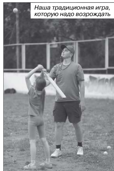
Наша традиционная игра, которую надо возрождать