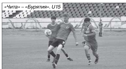
«Чита» – «Бурятия». U15