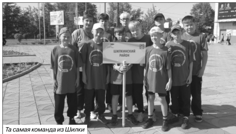
Та самая команда из Шилки

множество болельщиков, и, мне кажется, ребята из Читы оказались несколько растеряны, в то время как хозяева поля чувствовали себя уверенно».