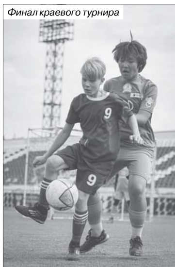
Финал краевого турнира

Романов также отметил успешное проведение муниципальных этапов по футболу: «Практически все районы края приняли участие. На краевой турнир было заявлено тридцать команд, и двадцать восемь из