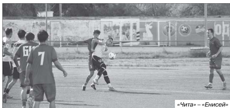
«Чита» – «Енисей»

Возобновились матчи в Третьей лиге («Зона Сибирь. Золото»). Впрочем, этого почти никто не заметил на фоне проходящего чемпионата мира. После впечатляющей победы над красноярским «Рассветом» в домашнем поединке, состоявшемся 7 июля на поле стадиона «Локомотив», наша команда пока свободна от игр.