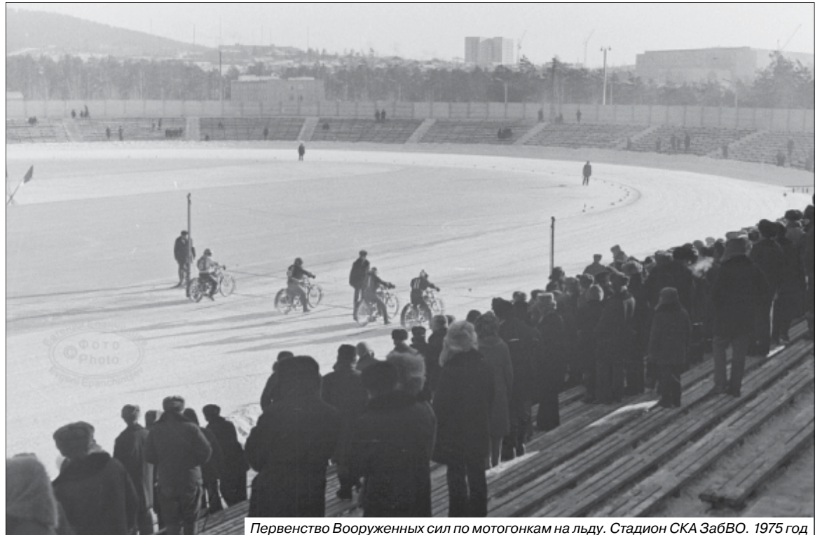
Первенство Вооружённых сил по мотогонкам на льду. Стадион СКА ЗабВО. 1975 год

Большинство городских и областных соревнований по мотокроссу проводились на кроссовой трассе в районе реки Кайдаловки. Вот и областные соревнования на лично-командное первенство по мотоциклетному кроссу 1969 года проходил здесь же. В командном зачёте, из семи участвующих команд, первые три места завоевали мотогонщики Читинского автотоклуба, Центрального района и Карымского