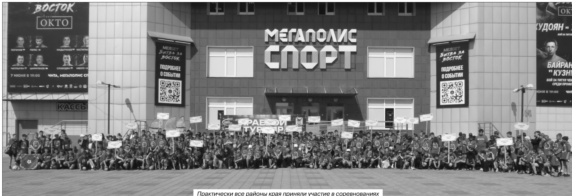
Практически все районы края приняли участие в соревнованиях

Валентин ОЛЕЙНИКОВ Фото автора, а также со страницы сообщества «СпортБЫСТРЫХ» во «ВКонтакте»