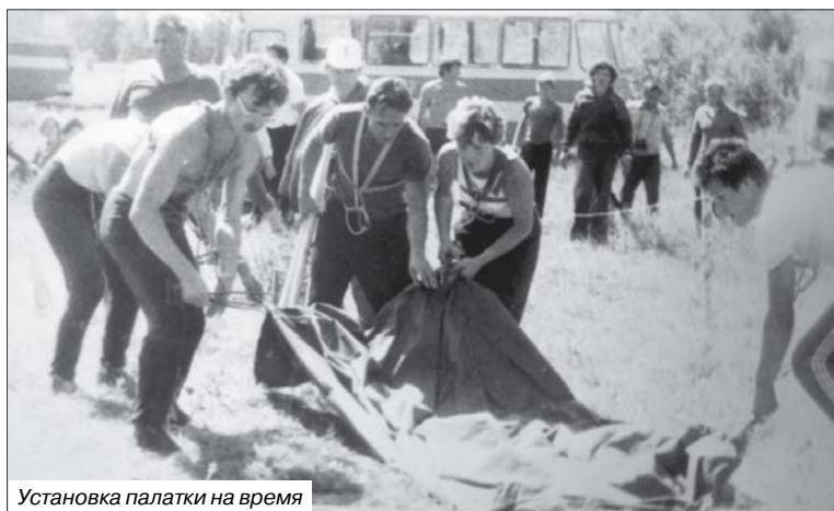
Установка палатки на время