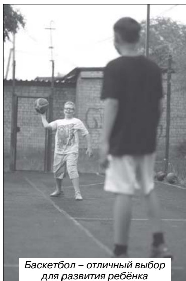
Баскетбол – отличный выбор для развития ребёнка