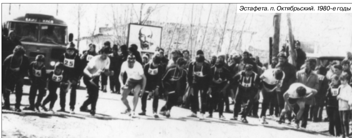
Эстафета. п. Октябрьский. 1980-е годы