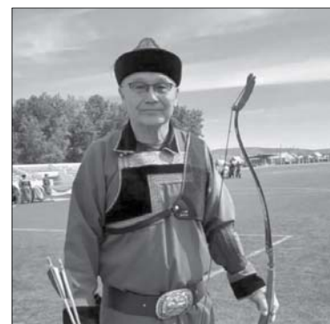
В этот день на стадионе посёлка Агинское было ярко и празднично