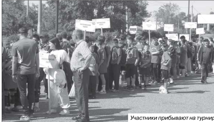
Участники прибывают на турнир

Год от года растёт не только количество участников, но и уровень подготовки команд: «Когда мы приезжаем на краевой турнир, то видим, что все муниципалитеты стараются,