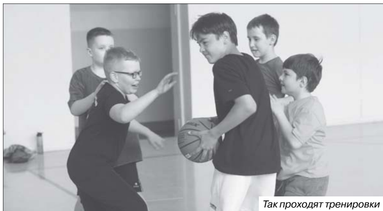
Так проходят тренировки