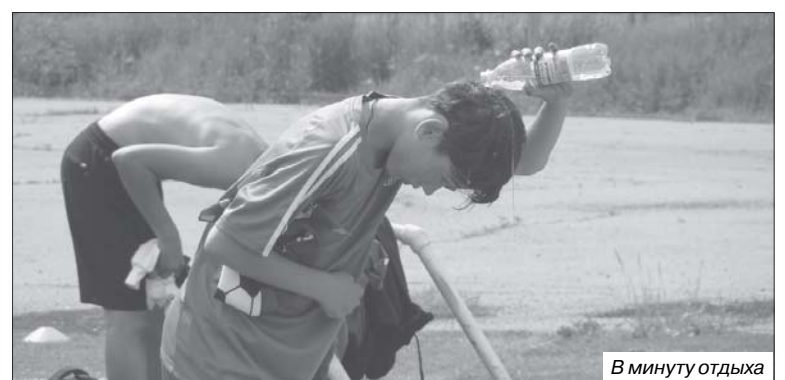
В минуту отдыха